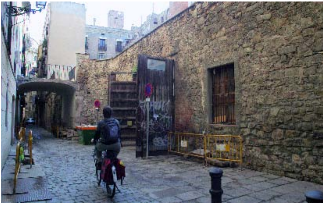
Vista del solar on es construirà la nova escola bressol.