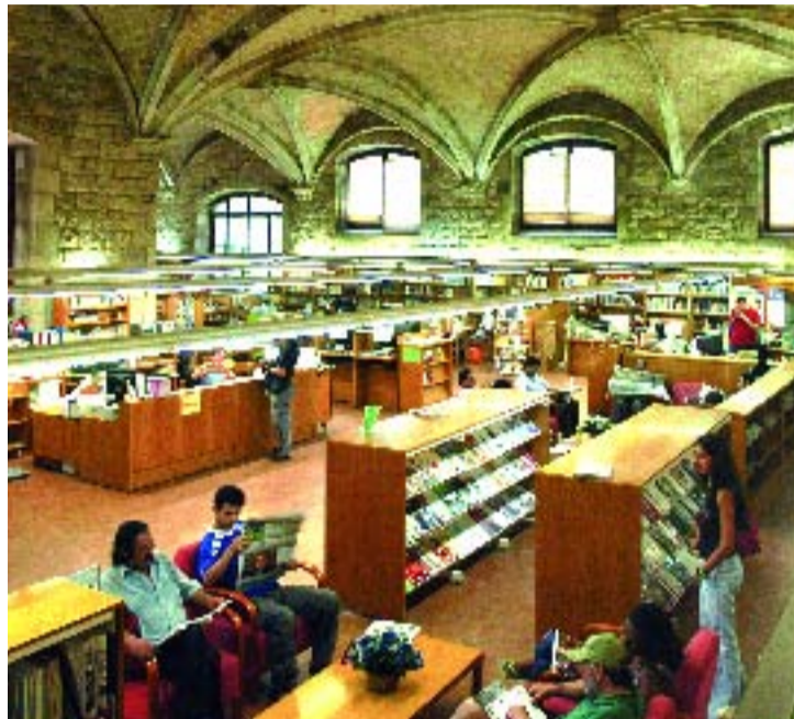
Imatge de la Biblioteca de Sant Pau-Santa Creu.

La biblioteca és un centre obert a tothom, viu i dinàmic, que permet compartir recursos i gaudir de serveis per accedir a la cultura