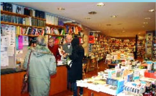
Documenta va néixer el 1975.