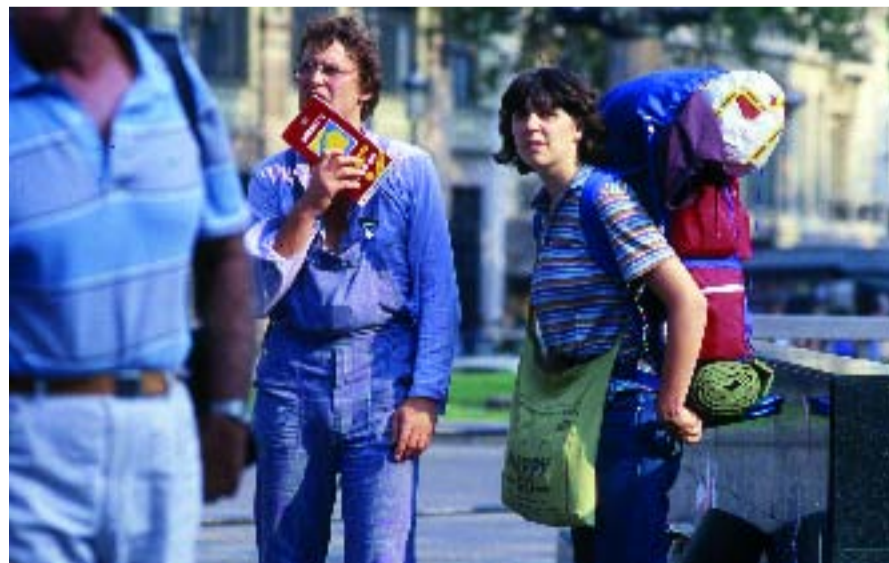
Turistes a Ciutat Vella.

L'existència d'apartaments il·legals per a turistes, que es lloguen per dies o per setmanes, és una realitat a la majoria dels barris de Ciutat Vella. L'èxit turístic del centre històric de la ciutat ha convertit molts dels seus habitatges en allotjaments improvisats que s'escapen de tota regulació i que molt sovint no reuneixen les característiques mínimes de qualitat requerides pel sector. El Districte de Ciutat Vella i l'Associació d'Apartaments Turístics de Barcelona (APARTUR) treballaran junts per garantir la correcta qualitat del servei d'apartaments turístics i alhora per limitar l'aparició de nous allotjaments il·legals. Les noves mesures pretenen garantir la continuïtat del teixit veïnal dels barris.