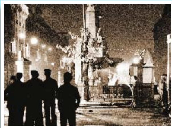
El rodatge de la pel·lícula Victòria a la plaça Palau, una nit d'estiu de 1981.

Si té fotografies o documents del seu barri, en pot fer donació a l'Arxiu Municipal del Districte, 93 443 22 65