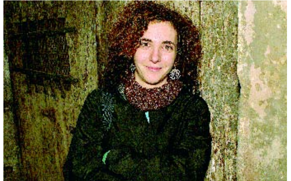
Nascuda a Sant Quirze de Besora, se sent molt a gust al carrer Comerç.