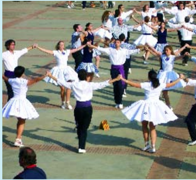
Els dansaires de Les Violetes amb el nou vestuari de la colla.