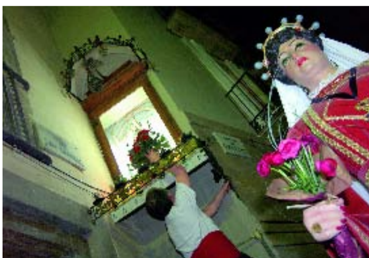
La baixada de Santa Eulàlia, punt habitual de les cercaviles de la festa.