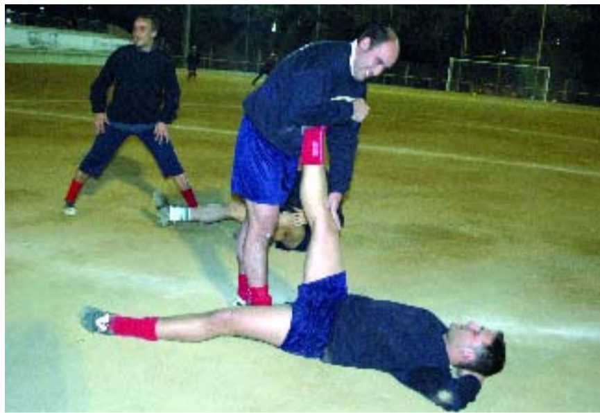
El club compta amb 170 nois i noies de totes les edats.

Ferrer indica que “un dels meus somnis i il·lusions és ensenyar amb els mitjans i les persones escaients tots els secrets del futbol. No tanquem la