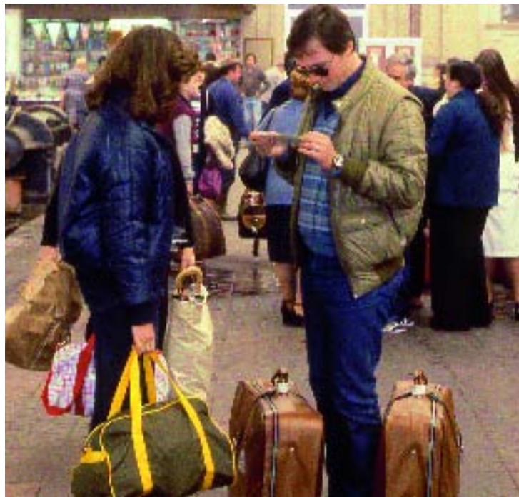
Es vol millorar l'atenció als turistes i reduir molèsties als veïns.

La seva contractació es fa majoritàriament per Internet, gestió que pràcticament