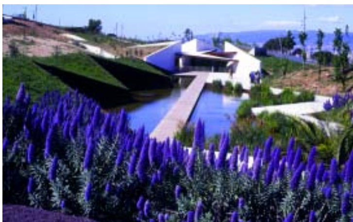
El jardí botànic de Montjuïc.