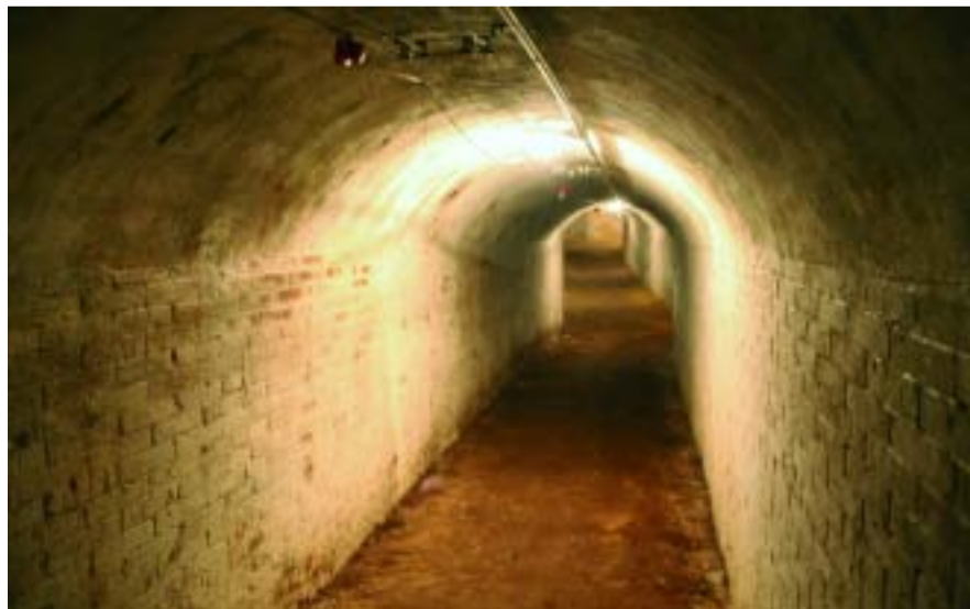
El refugi 307 és ubicat al capdamunt del carrer Nou de la Rambla.

Barcelona va ser bombardejada insistentment per les aviacions italiana i alemanya, aliades de les tropes franquistes. Després del primer bombardeig, efectuat per sorpresa la nit del 13 de febrer de 1937 pel creuer italià Eugenio di Savoia, la ciutat va començar a construir refugis. Un d'aquests va ser el Refugi 307, excavat al capdamunt del carrer Nou de la Rambla, al barri del Poble-sec. Després d'unes obres de condicionament, torna a obrir les portes per mostrar les condicions de vida que es van donar entre les seves parets i com eren les estances que el formaven. Vol ser, també, un homenatge a les víctimes dels bombardejos d'arreu del món.