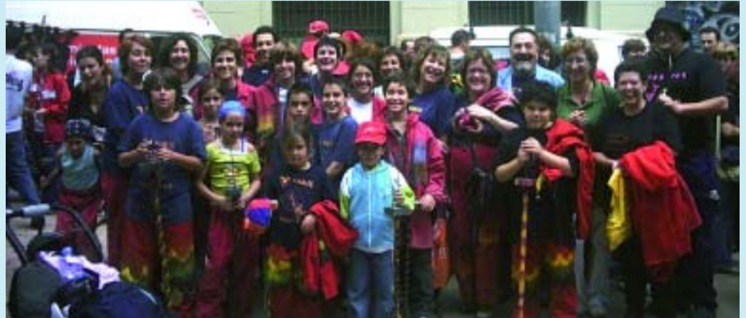
La colla infantil dels diables s'anomena fills de Satan del Poble-sec.

Són uns 40 diables entre la colla infantil, la d'adults i els tabalers que omplen els carrers i places de foc, retron de tambors i molta festa