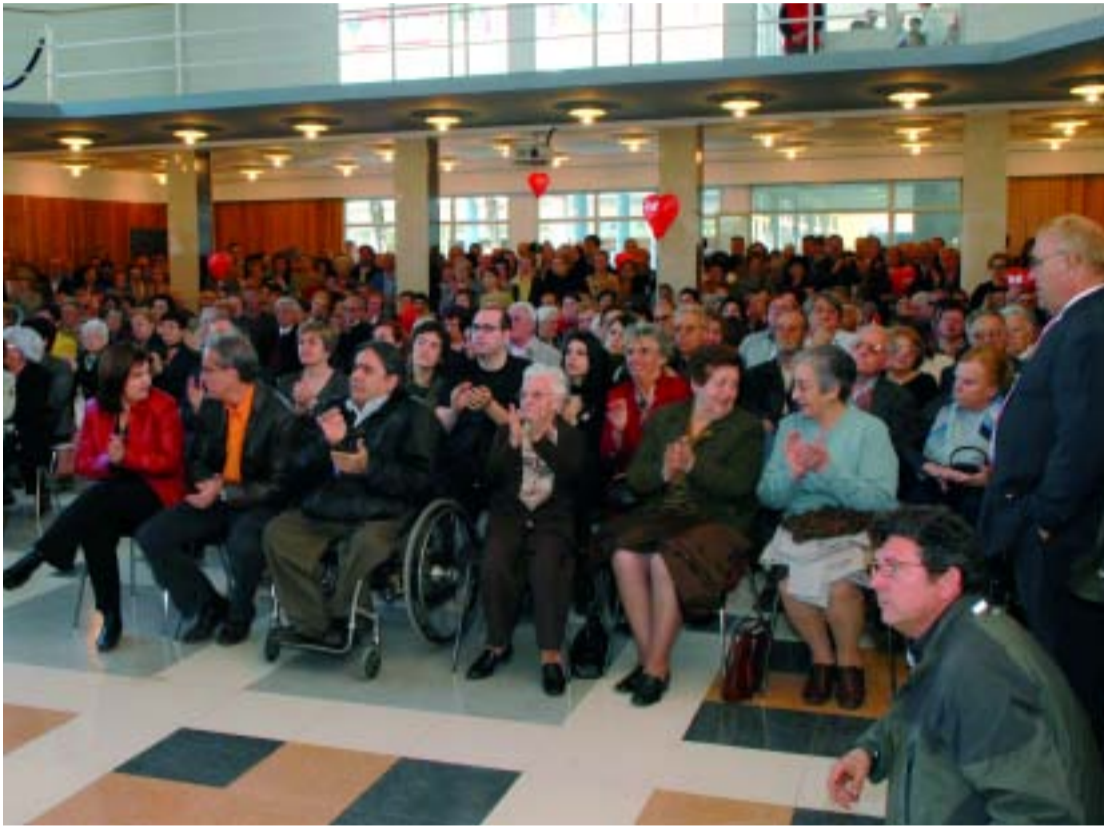
El Centre Pepita Casanellas durant la jornada de portes obertes del dia 18 de març.

L'equipament es troba als antics menjadors de la Philips. Hi ha una Oficina d'Atenció al Ciutadà, el Centre de Serveis Socials de la Marina i una sala per a actes culturals a disposició de les entitats