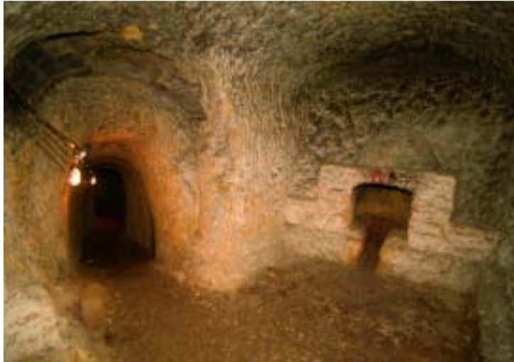
Llar de foc que va ser construïda amb posterioritat a la guerra.

D ia 13 de febrer de 1937. Eren poc més de les 10 de la nit. Feia mesos que el general Franco s'havia rebel·lat i provocat l'esclat de la Guerra Civil. Barcelona, però, vivia tranquil·la. Passats els primers moments de desgavell, el dia a dia havia esdevingut més tranquil. El front era lluny, molt lluny, i la major part de la ciutadania vivia la guerra com una cosa apartada. De cop comencen a sentir-se diversos esclats. Són les bombes llançades des del creuer italià Eugenio di Savoia que s'ha desplaçat expressament per bombardejar la capital catalana. De sobte, la població civil s'ha convertit en un objectiu militar més. Barcelona, situada a la rereguarda, passa a ser la primera ciutat de més d'un milió d'habitants bombardejada de forma indiscriminada amb l'objectiu de crear el caos, la confusió i el desànim entre la població civil. Després d'aquest bombardeig, n'hi va haver molts d'altres realitzats per l'aviació italiana i la Legió Còndor alemanya. Una de les reaccions de l'Ad-