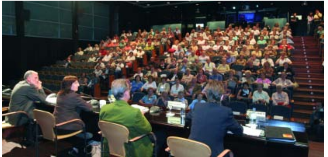
La quinzena se celebra tots els anys des de 1991.