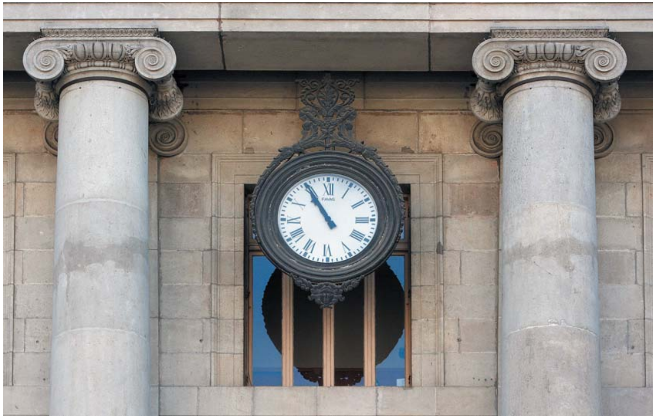
El rellotge de l'Ajuntament, instal·lat el 1852, té la figura d'un gran pèndol.

d'un balcó de ferro. El projecte inicial de l'edifici va ser realitzat per l'arquitecte municipal Antoni Rovira i Trias (1816-1889), que va dirigir l'enderroc de les muralles de Barcelona i va guanyar el concurs per a la reforma de l'Eixample, tot i que l'Estat va imposar el projecte de Cerdà. Desembocant a la plaça de Pep Ventura de Vallvidrera, on arriba el funicular, hi ha el carrer de Navarro Reverter; al número 1 hi trobem un edifici que té a cada banda un rellotge de sol de colors granat i ocre. “De pressa fugen les hores, de pressa i no tornen més...”, diu el vers de Miquel dels Sants Oliver, al seu interior. La torre és modernista, estil que va pujar a Vallvidrera a principis del segle XX, quan unes quantes famílies benestants de Barcelona van instal·lar-s'hi per estiuejar.