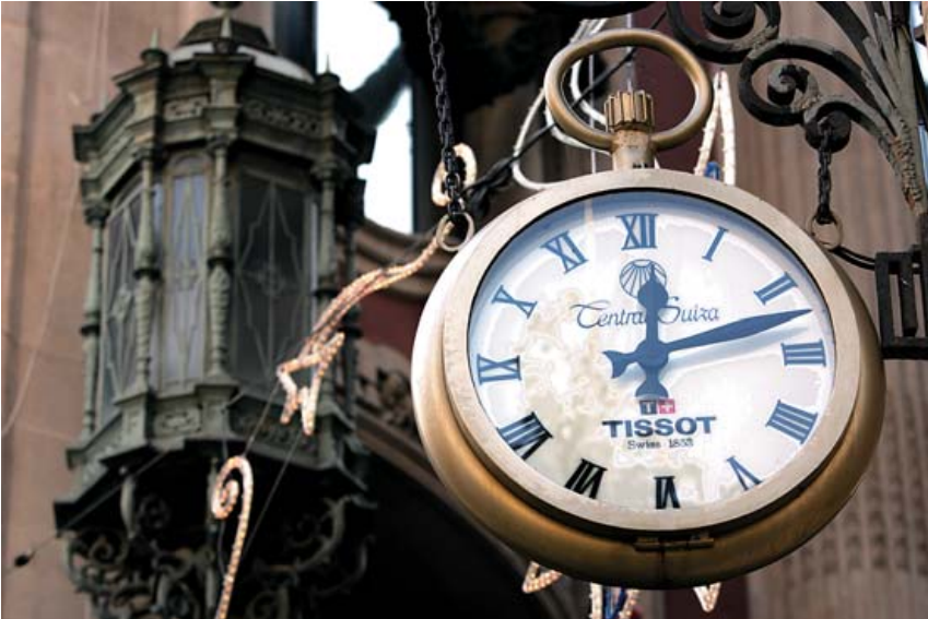
D'esquerra a dreta i de dalt a baix: l'antiga foneria de canons, amb el rellotge restaurat un cop desaparegut l'escut franquista; el rellotge giratori del BBVA; el de l'Acadèmia de les Ciències i les Arts i el de la Central Suïça. A la pàgina anterior: La Sfera, antiga seu del Banco Central.

A l'avinguda del Portal de l'Àngel, 23 (cantonada carrer de Santa Anna), penjat de la façana, hi ha instal·lat des del 1933 un rellotge d'un metre de diàmetre propietat de la botiga Central Suïça, dedicada als rellotges, la joieria i els objectes de plata. Per la seva forma, recorda els rellotges que abans es portaven amb una cadeneta enganxats a la butxaca. Un rellotge suís, de precisió, no podia faltar al centre de la ciutat, però diuen que ara que és elèctric s'avança lleugerament a causa de les oscil·lacions del corrent, mentre que abans, que era de corda, era molt exacte.